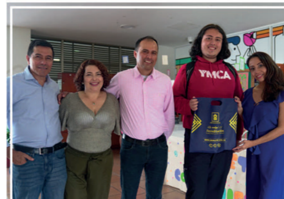
Con agenda académica y artística, la biblioteca Jaime Macías de UNIMAYOR celebró, junto a la comunidad universitaria, el Día Internacional de la Tierra y el Idioma .

Durante el mes de abril, con el propósito de promover el registro y protección de los resultados institucionales producto de las actividades de docencia, investigación, proyección social, desarrollo tecnológico, innovación, creación artística y cultural y/o relacionamiento con el sector externo, la Vicerrectoría Académica y de Investigaciones de la Institución Universitaria Colegio Mayor del Cauca desarrolló la Convocatoria de Protección y Creación de Intangibles, vía Propiedad Intelectual 2024 . Esta iniciativa destaca el compromiso de la Institución con el avance académico y la innovación, asegurando que la propiedad intelectual sea reconocida y valorada en el ámbito universitario.