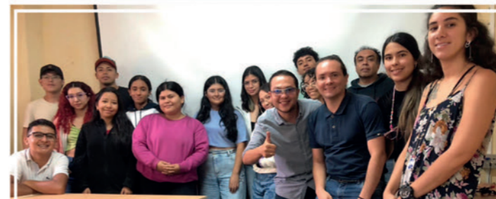
El programa Diseño Visual lideró con éxito CÓDICE 2024 , evento académico de UNIMAYOR que giró en torno a la imagen digital y las convergencias narrativas e interactivas.