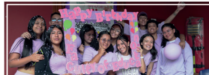
Con alegría y variedad de actividades integrativas, estudiantes, docentes y administrativos, celebraron los 3 años de la Facultad de Educación de UNIMAYOR .