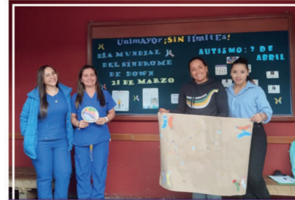
En el marco del Día Mundial del Síndrome de Down y el Día del Autismo, se realizó la campaña 'UNIMAYOR sin Límites', para sensibilizar a la comunidad sobre el valor de la diversidad y la inclusión.