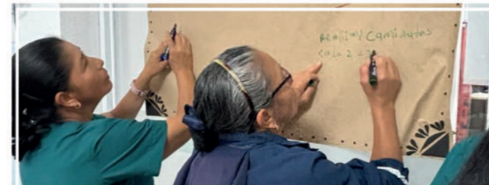
El equipo de Talento Humano UNIMAYOR realizó el taller 'Brillando Desde Adentro', para pensionados y prepensionados de la Institución. Con él, se promueve la aceptación y valoración de habilidades individuales.