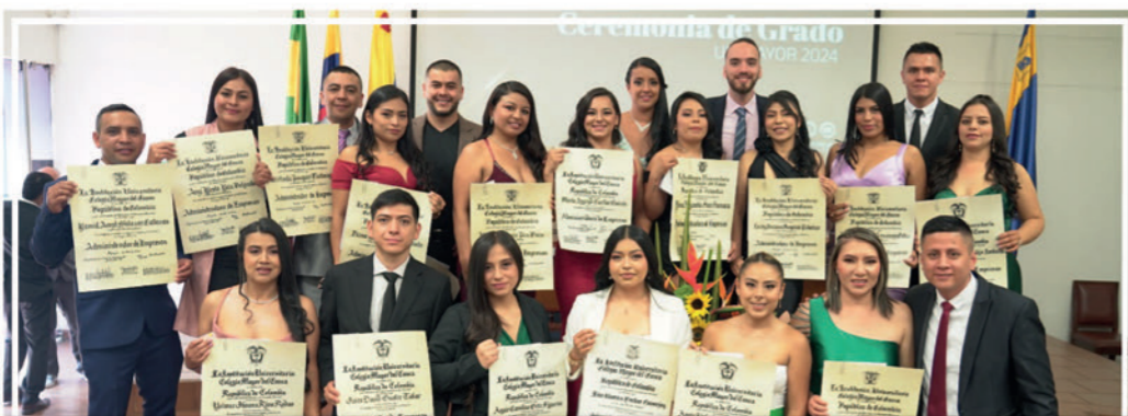
Con alegría y orgullo, UNIMAYOR graduó a un nuevo grupo de profesionales que saldrán a transformar el mundo ¡Felicitaciones y muchos éxitos!