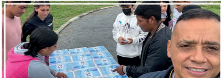
Comprometida con el medio ambiente, UNIMAYOR participó en la 'Semana del Agua' organizada por la Universidad del Cauca y la Empresa de Acueducto y Alcantarilla de Popayán.