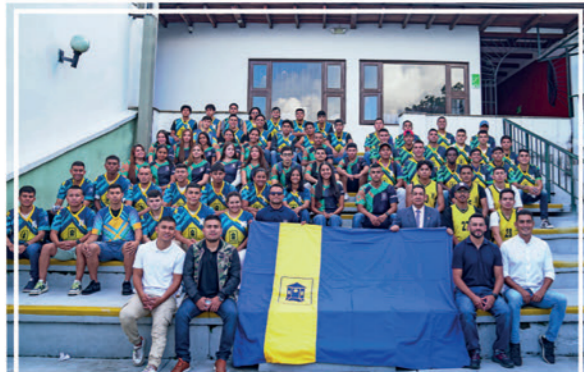
91 estudiantes y deportistas UNIMAYOR recibieron con orgullo y compromiso la bandera institucional para las competencias ASCUN, zonal Cauca 2024, las cuales se desarrollan en diferentes escenarios de la ciudad de Popayán.