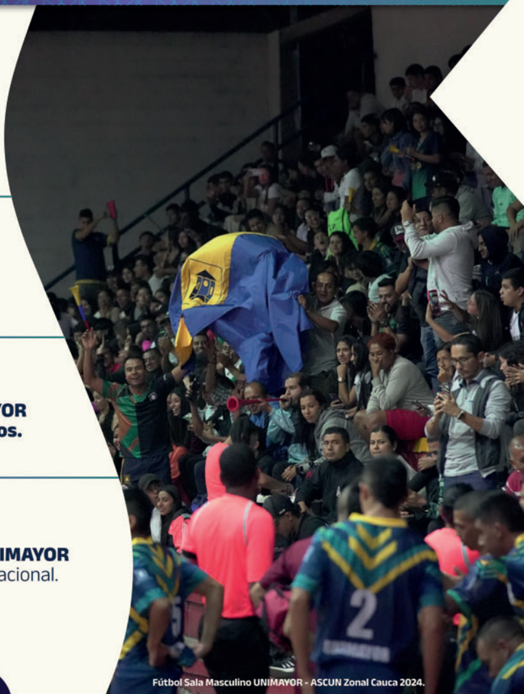
Fútbol Sala Masculino UNIMAYOR - ASCUN Zonal Cauca 2024.

Investigaciones del Semillero SIED de UNIMAYOR impactan en importante encuentro internacional.