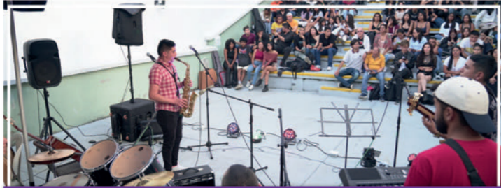
El área de Cultura de Bienestar Institucional organizó el evento 'Tertulia y Jam musical', donde participaron, activamente, grupos, bandas y orquestas musicales de diferentes Instituciones Universitarias.